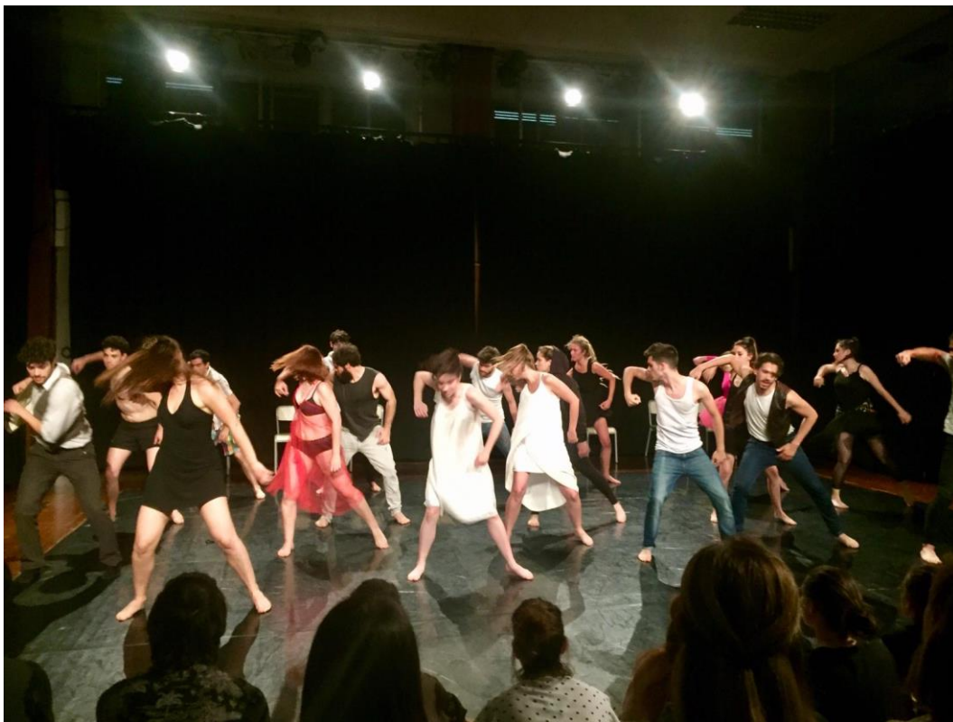
Abschlusspräsentation des Tanzmoduls

Alles in allem bin ich sehr froh darüber, mich für ein Jahr in Valencia entschieden zu haben. Es war eine sehr bereichernde Erfahrung, die mich durch ihre Höhen und Tiefen einiges gelehrt hat und sowohl innerhalb als auch außerhalb des Unikontextes hat wachsen lassen. Ich kann solch einen Aufenthalt und auch im speziellen die ESAD Valencia nur wärmstens weiterempfehlen, und das im wahrsten Sinne des Wortes; denn wenn es eins in Valencia nicht war, dann kalt.