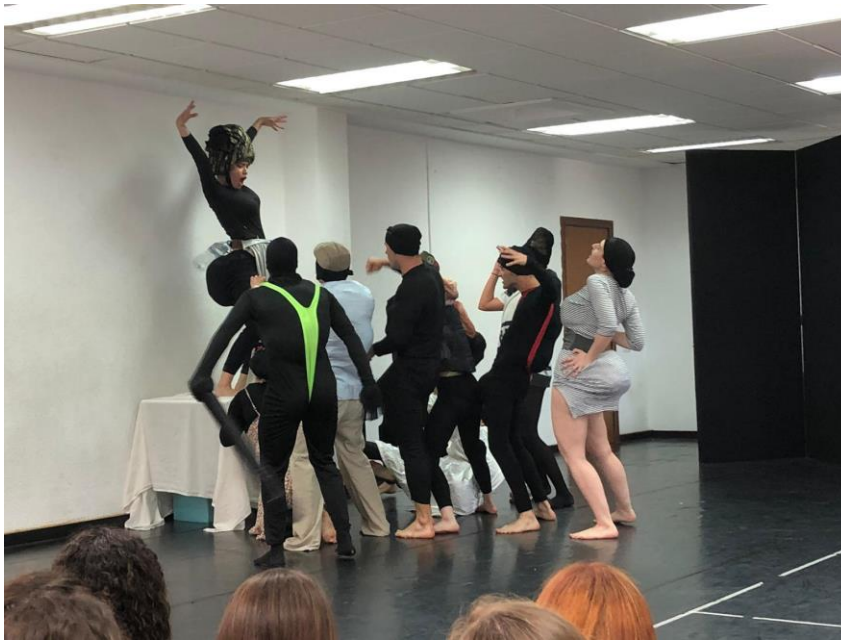
Aufführung einer Impro aus dem Clownunterricht