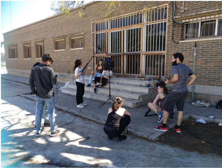
Während den Aufnahmen für das Fach: „Schauspiel vor der Kamera“

Glücklicherweise konnte ich schon fließend Spanisch sprechen, bevor ich das Auslandssemester begann, so konnte ich dem Unterricht von Anfang an gut folgen und auch an allen Übungen problemlos teilnehmen. Dies führte jedoch auch dazu, dass schnell vergessen wurde, dass ich eine Erasmusstudentin bin und spanisch nicht meine Muttersprache ist. Ich wurde so behandelt wie alle anderen auch, was einerseits wunderbar ist, auf der anderen Seite auch sehr anstrengend sein kann. Dazu muss gesagt werden, dass in Valencia „Valenciano“, ein Dialekt des Catalan, gesprochen wird. Dies ist an der Uni nicht unbedingt der Fall, da aber ein großer Teil der Kultur auf dieser Sprache abläuft, konnte es schon dazu kommen, dass zwischendurch im Unterricht die Sprache gewechselt wurde oder einige Szenen auf Valenciano gespielt wurden. Anfangs war dies für mich etwas verwirrend, später fand ich es aber eigentlich eher positiv die Chance bekommen zu haben, noch eine weitere Sprache zu lernen (Auch wenn ich durch die große Anzahl von Unterrichtsstunden leider keine Zeit hatte einen Sprachkurs für Valenciano zu belegen).