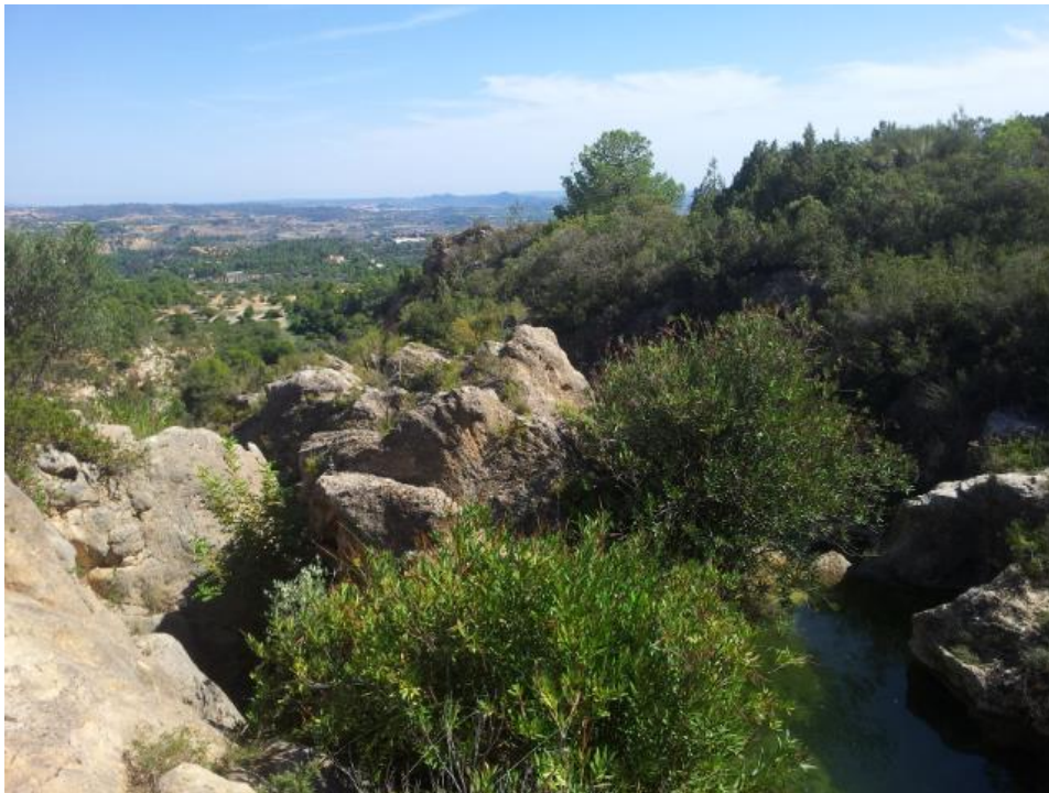
Wandern im Umland von Valencia

Möchte man in der Stadt ein wenig raus aus dem Trubel, so eignet sich ein Spaziergang durch den „Turia“; ein ehemaliger Fluss, der nun ausgetrocknet ist und sich als riesiger Park durch die Stadt erstreckt. Hier befindet sich auch die „Ciudad de artes y ciencias“, ein Komplex von futuristisch aussehenden Gebäuden (Museen, botanischer Garten, Aquarium), ein bekanntes Postkartenmotiv. Und für die Meerliebhaber gibt es den großen Strand, welcher trotz Großstadt nicht bis hin zur Promenade bebaut ist mit Hotels und Touristenattraktionen, sondern nach wie vor an ein eher ärmliches, ehemaliges Fischerviertel, grenzt. Doch auch hier ist die Gentrifizierung im Gange und immer mehr der kleinen, süßen Häuser mit Keramikkacheln werden aufgekauft, renoviert und mit hippen Cafés und Bars gefüllt.